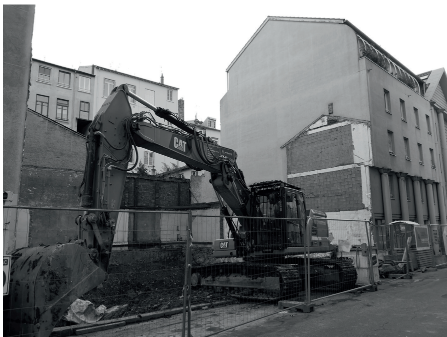
Trouble de voisinage (photo d'illustration).

La valeur actuelle (cour d'appel de Nîmes, 6 décembre 2018, n°17/01259) du bien ne peut être établie sur la base de simples « attestations immobilières, trop vagues et imprécises, et ne