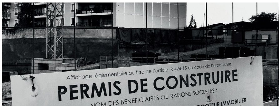
Trouble de voisinage (photo d'illustration).

Dès lors, à quel moment la frontière de l'anormalité est-elle franchie ? À quel moment le seuil de nuisance, de tolérance 18 , du supportable 19 est-il dépassé ? Quand la « capacité de résistance de l'homme » 20 est-elle franchie ? La norme en la matière est une notion imprécise et empreinte d'une certaine dose de subjectivité, de part et d'autre d'ailleurs. Et c'est encore une fois au juge, souverain, qu'incombe la lourde tâche « d'apprécier s'il s'agit d'inconvénients excessifs compte tenu de l'environnement, caractérisé par